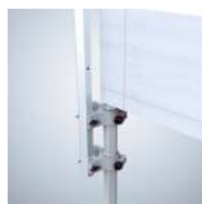
Support de voile