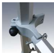
Barre de renfort