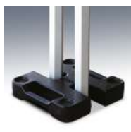
Poids de lestage